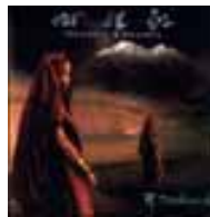
Folk / Pop